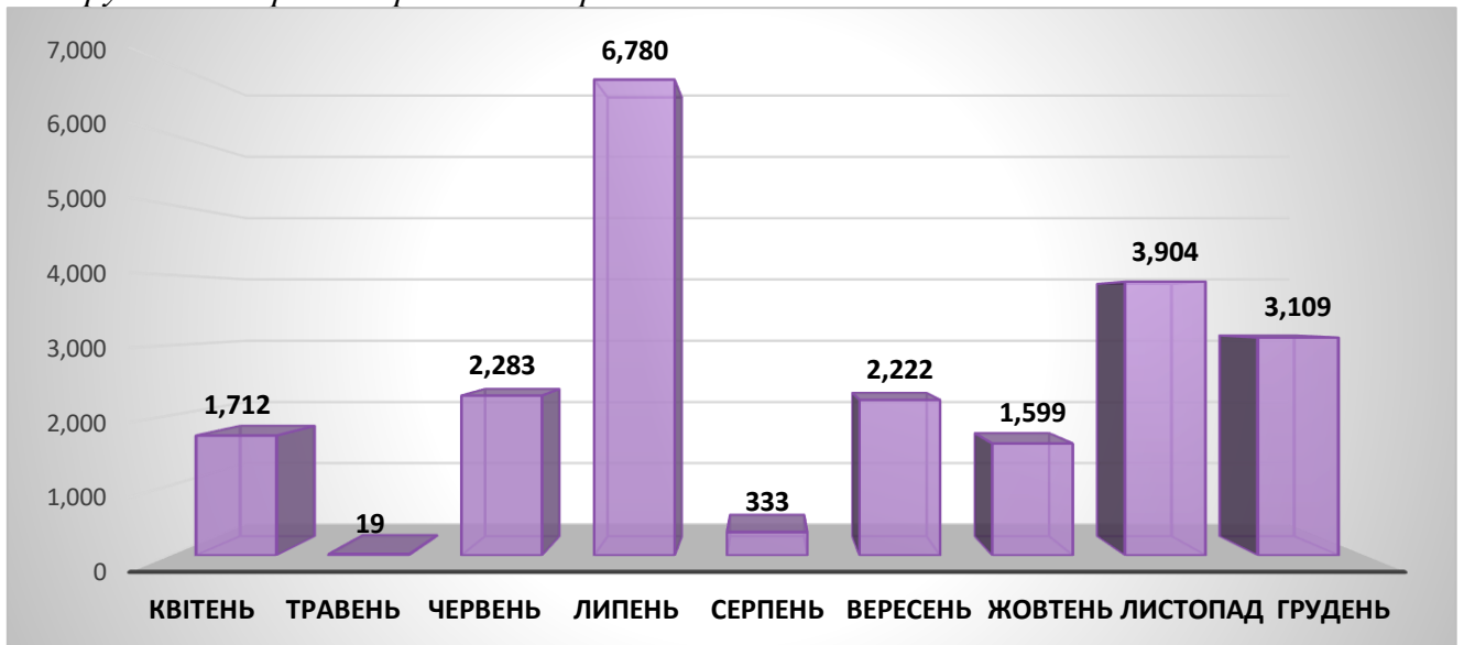
Рис. 1 Загальна кількість кандидатів, які проходили процедуру оцінювання у Центрі протягом квітня – грудня 2019 року

Загальна кількість кандидатів, які проходили процедуру оцінювання у Центрі протягом квітня – грудня 2019 р. відображено на рис. 1