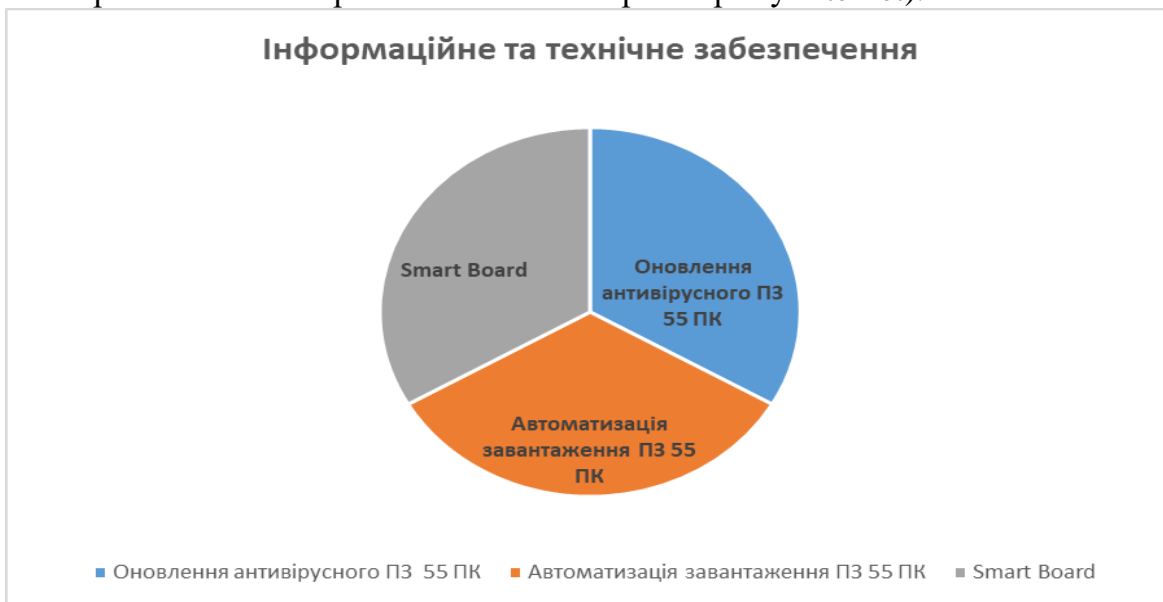
Рис. 5 Здійснення інформаційного та технічного забезпечення станом на 24.06.2019

З метою покращення взаємодії з кандидатами та працівниками Центру, а також для підтримки внутрішньо відомчої взаємодії та обміном знаннями, було встановлено сучасне технологічне рішення – SmartBoard (інтерактивна дошка з можливістю під'єднання до смартфонів та трансляванням “робочої області” через мережу Internet).