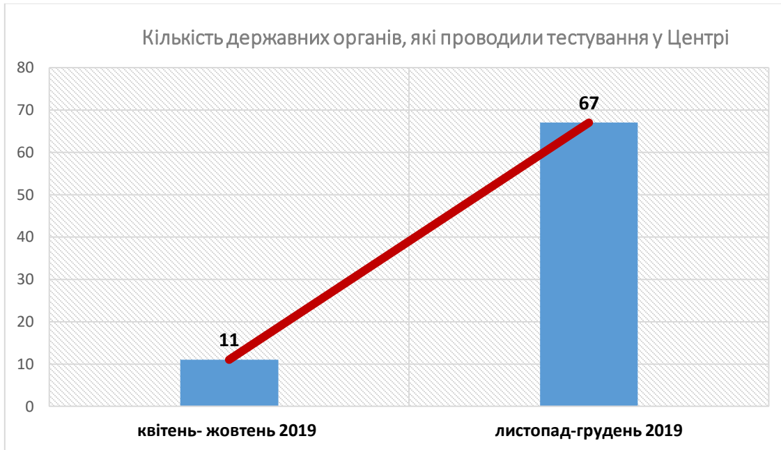
Рис.5 Кількість державних органів, які проводили тестування у Центрі протягом квітня-жовтня 2019 р. та листопада-грудня 2019 р

Співвідношення кількості державних органів, які проводили тестування у Центрі протягом квітня-жовтня 2019 р. та листопада-грудня 2019 р. відображено на рис.5