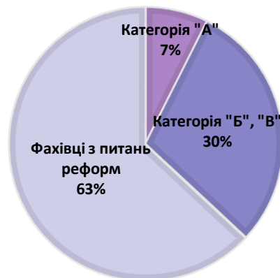
Рис. 3 Співвідношення кількості кандидатів, які проходили процедуру оцінювання у Центрі в залежності від категорії посади упродовж квітня - грудня 2019 року

Співвідношення кількості кандидатів, які проходили процедуру оцінювання у Центрі в залежності від категорії посади відображено на рис.3