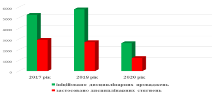
Загальна кількість дисциплінарних проваджень на дисциплінарних стягнень у державних органах за 2017, 2018 та 2020 роки у порівнянні